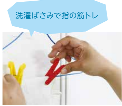
洗濯ばさみで指の筋トレ

洗濯ものを干す時に、あえて指をかえて留めてみる。薬指や小指を使うと意外に難しいのでぜひやってみてください。