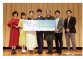
試写会の様子 (舞台挨拶公式写真)

4月末より劇場公開された映画「ピア」まちをつなぐもの〜にあいセーフティネットワークが協賛しました。テーマは在宅医療。若手医師が悩みながらも懸命に高齢化社会の大きな課題に取り組みで行くストーリーです。エンドロールにはあいクリニックの医師が実際に訪問診療を行っている写真も使用されました。