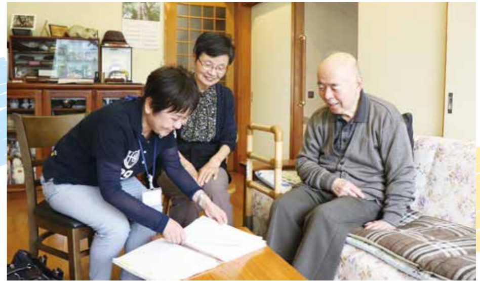
利用者さんのお家でサービスの説明をするケアマネジャー(左)

いつまでも元気で暮らしたいけれど、長生きするほど避けては通れないのが医療と介護の問題です。今回は介護保険サービスの調整役であるケアマネジャー（介護支援専門員）に、気になる介護サービスのあれこれを聞いてみました。ご自分のためご家族のために、まずはこれだけ知っていれば安心です。