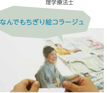
なんでもちぎり絵コラージュ

指先を意識しながら新聞紙をぐしゃぐしゃと力いっぱい丸める。資源ゴミの日には丸めて出すなど決めても楽しいかも?