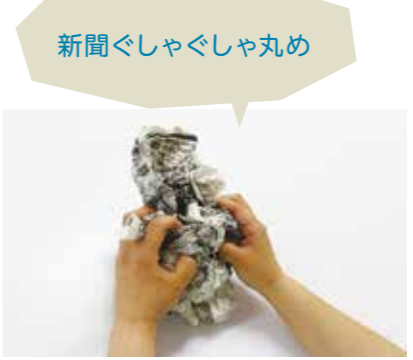
新聞ぐしゃぐしゃ丸め

洗濯ものを干す時に、あえて指をかえて留めてみる。薬指や小指を使うと意外に難しいのでぜひやってみてください。