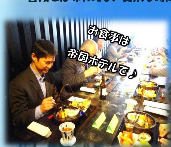
お食事は 帝国ホテルで♪

11月26日(日)26名のテイケアご利用者、ご家族と一緒に大型バスを貸切り、帝国ホテルでの食と語らいの時間、そしてその後には。。。華麗で豪華な顔と、江戸から続く下町風情の顔が共存している街 銀座を職員と一緒に歩きました。普段では味わえない贅沢な時間を過ごして参りました。