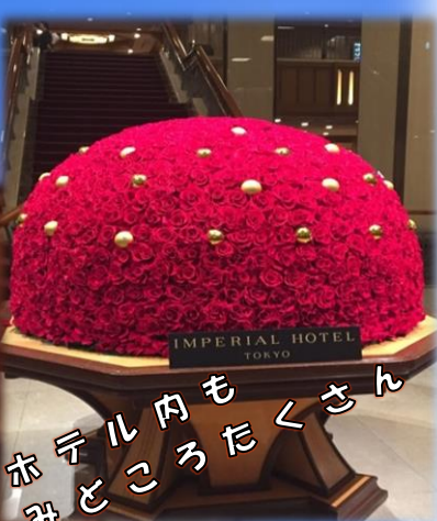
ホテル内も みどころたくさん